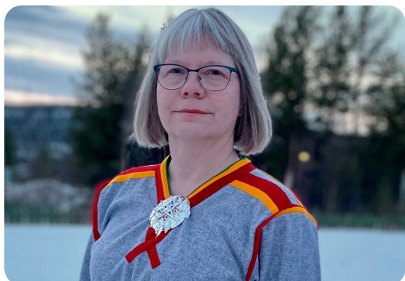
Artikkelen " Violence in Sámi communities: From too frightened to touch to openness " var den mest leste saken på eeagender.org i 2022.

Nettsiden eeagender.org hadde litt over 10 300 sidevisninger i 2022. Kilden drifter også en LinkedIn-side for SYNERGY-nettverket med mål om å skape oppmerksomhet rundt nettsiden, og spre den til relevante målgrupper. Fra den ble lansert i slutten av 2021 har kanalen økt til 79 følgere ved slutten av 2022. Kilden skriver egne halvårsrapporter til JD for oppdraget.