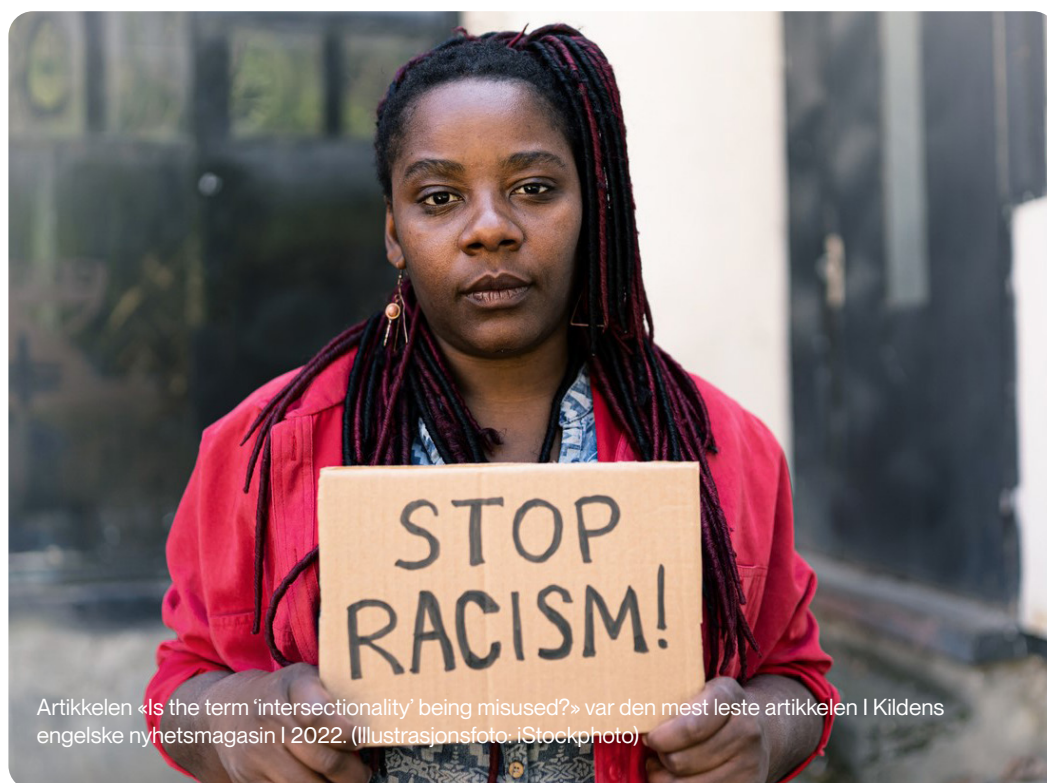
Artikkelen «Is the term 'intersectionality' being misused?» var den mest leste artikkelen i Kildens engelske nyhetsmagasin i 2022.