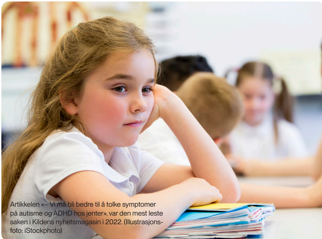
Artikkelen «– Vi må bli bedre til å tolke symptomer på autisme og ADHD hos jenter», var den mest leste saken i Kildens nyhetsmagasin i 2022.