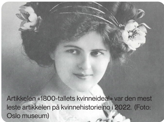
Artikkelen «1800-tallets kvinneideal» var den mest leste artikkelen på kvinnehistorie.no i 2022.

Det mest populære temaet på kvinnehistorie.no er 1970-tallets kvinnekamp (4985 visninger), fulgt av Samiske kvinner (2716) og Litteratur (2704 visninger).