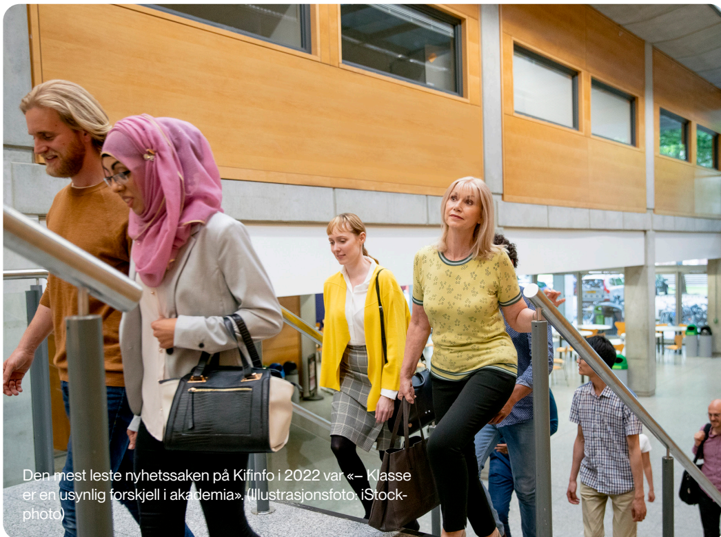
Den mest leste nyhetssaken på Kifinfo i 2022 var «– Klasse er en usynlig forskjell i akademien».

Vi bistår også Kif-komiteen med kommunikasjonsarbeid, i 2022 blant annet i forbindelse med komiteens to arrangementer.