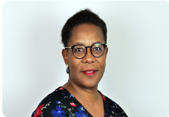
Den tredje mest leste saken i 2022 handler om rasisme i lærerutdanningen.