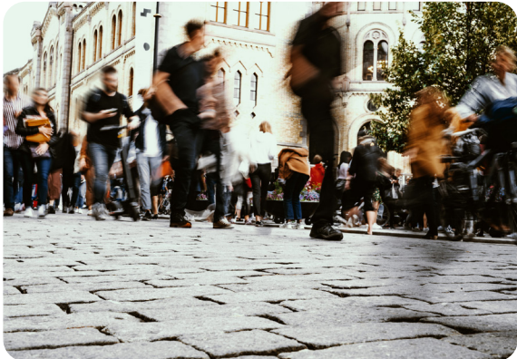
Nyhetssaken Hverdagsrasisme finnes også i akademia var den nest mest leste saken i 2022.

I 2021 hadde vi en kronikkserie der Kif-medlemmene skrev om aktuelle temaer. Den siste i rekka ble publisert i januar 2022. Kronikken handlet om diskriminering og ble også godt lest.