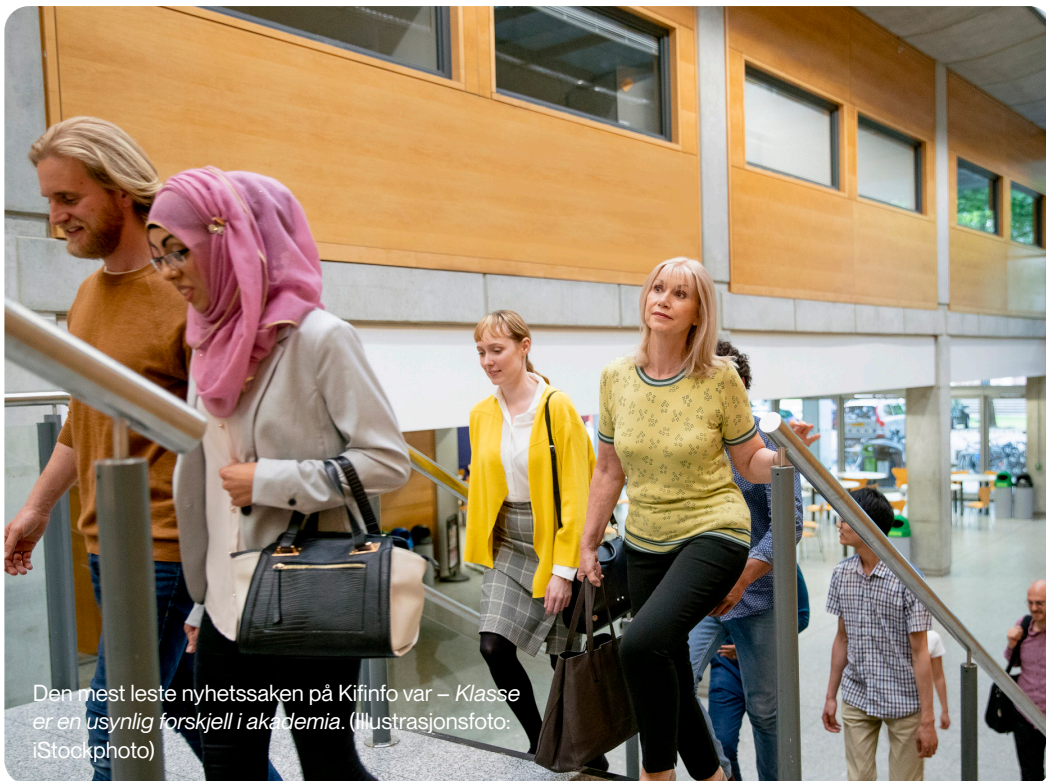
Den mest leste nyhetssaken på Kifinfo var – Klasse er en usynlig forskjell i akademia.

Kilden kjønnsforskning.no republiserer også nyhetssaker fra kifinfo.no. I tillegg legger vi inn egenskrevne nyhetssaker fra kifinfo.no og pressemeldinger hos NTB.